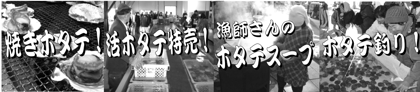
※海況により販売物が変更となる場合があります。

「のだ塩ラーメン(ホタテ入り)」「のだ塩焼きそば(ホタテ入り)」「特製ホタテ餃子」「鮭の醤油漬けあぶり焼き」などご当地グルメも満載!